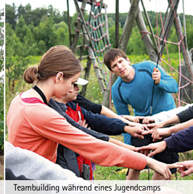
Teambuilding während eines Jugendcamps