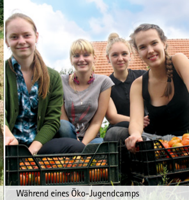
Während eines Öko-Jugendcamps