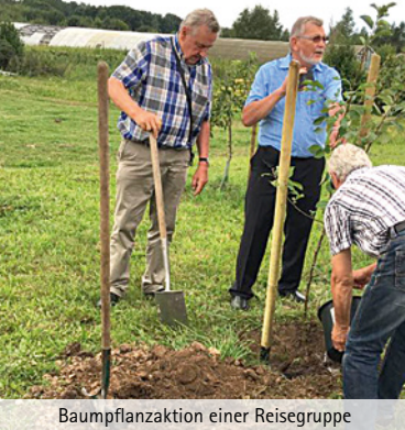
Baumpflanzaktion einer Reisegruppe