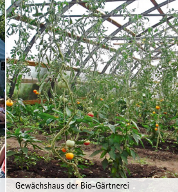
Gewächshaus der Bio-Gärtnerei